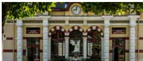
Le bâtiment Niepce (1853) deviendra un espace dédié aux activités et ateliers complémentaires à la cure thermique conventionnée.

Les Thermes de Brides-les-Bains sont à peine livrés que Compagnie Lebon se penche sur les Thermes d'Allevard (Isère). Eux aussi vont connaître une restructuration pendant l'intersaison 2018/19. Objectif : offrir un parcours de soins thermaux confortable, fonctionnel en accueillant les curistes dans une seule et même unité de lieu, qu'ils soient en simple ou double orientation. Compagnie Lebon va consentir 3 M€ H.T. à cette restructuration/réorganisation confiée au cabinet MAES. Le spa aussi va profiter de cette réorganisation. Il double sa surface de soins, qui passe de 195 à 360 m 2 et s'offre un grand jacuzzi. Le projet a été retenu dans le Plan Thermal de la région Auvergne-Rhône-Alpes qui lui alloue 221 K€ de subventions. Les Thermes d'Allevard montreront leur nouveau visage dès le 22 avril 2019.