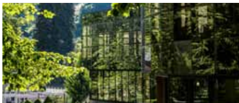
Le bâtiment Villiot (1991) abritera l'ensemble des soins thermaux voies respiratoires et rhumatologie.

Aujourd'hui les Thermes d'Allevard sont scindés en deux bâtiments distincts séparés par le parc thermal. Niepce, le bâtiment historique à la façade art déco (1853), dispense les soins thermaux voies respiratoires. Villiot (1991), bâtiment plus récent sur deux niveaux, reçoit les curistes en rhumatologie. Les rythmes, horaires et durée d'ouverture sont différents, ce qui complique l'organisation des soins, côté curistes comme côté professionnels.