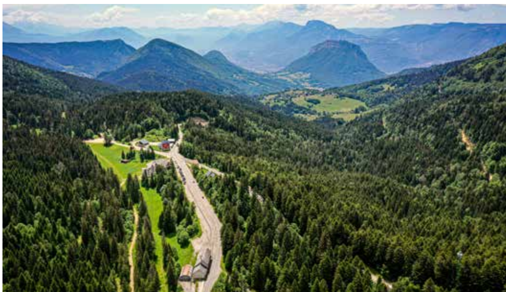
Vue aérienne sur le site du col de Porte