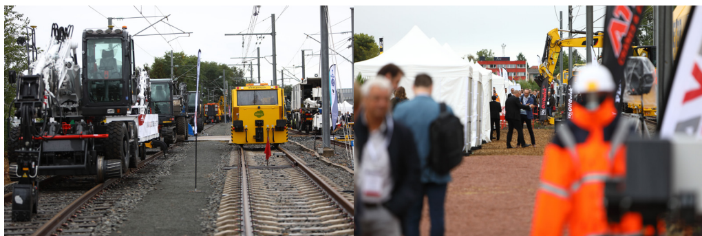
Mecateameetings est devenu l'évènement bisannuel incontournable pour l'industrie ferroviaire.

Malgré la crise sanitaire, la cinquième édition des Mecateameetings est confirmée du mercredi 22 au vendredi 24 septembre 2021 à Montceau-les-Mines (71). Voilà dix-huit mois que les professionnels des travaux ferroviaires ne se sont pas revus. Tous sont impatients de présenter leurs dernières innovations en matière d'engins et d'outillages. Premier locotracteur électrique, équipement d'inspection des caténaires, outil autonome pour déplacer des wagons... la demande d'exposition et de démonstration explose.