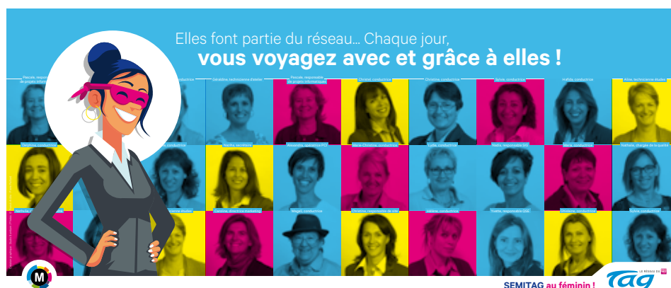
Les portraits de 50 salariées de la SEMITAG animent le réseau de transports en commun à l'occasion de la Journée Internationale des Femmes. Création : studio Bambam à Grenoble.

2 clients sur 3 des transports en commun à Grenoble sont des femmes... Mais elles sont 18% à exercer un métier dans ce secteur comme en témoigne la SEMITAG, société exploitante du réseau TAG. Une situation que l'entreprise veut rééquilibrer. Elle profite de la Journée Internationale des Femmes le 8 mars pour donner un coup de projecteurs aux femmes salariées de l'entreprise. Elle organise également des animations en interne comme sur le réseau pour susciter des vocations et lever les freins.