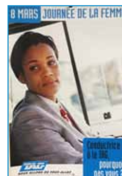
Affiche diffusée en 2002 pour la Journée Internationale des Droits des Femmes