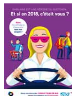
2 affiches de la campagne de recrutement de 80 conducteurs déployées sur le réseau TAG en janvier/février 2018.