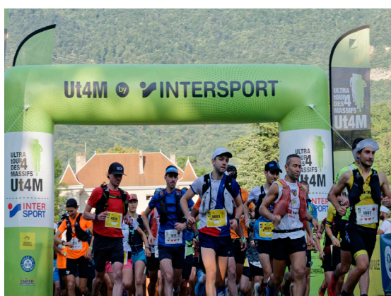
Toutes les photos contenues dans ce communiqué de presse sont des photos d'illustration.