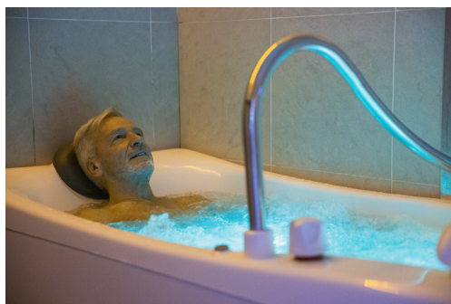
L'aérobain, soin intégré dans le cadre de l'expérimentation COVIDTHERM

Pilotée par le CHRU de Nancy, l'étude COVIDTHERM entend démontrer l'efficacité de la prise en charge thermique pour les personnes souffrant d'une affection post-COVID-19. Le Centre Thermal Saint-Eloy d'Amnéville participe à cette étude et accueillera dès le lancement de la saison thermique 2025 soixante patients pour cet essai clinique . Ils seront adressés par le CHRU de Nancy directement, qui prend en charge les frais liés à l'expérimentation. Ils se verront administrer quatre soins thermaux quotidiens pendant trois semaines : massage réalisé par un kinésithérapeute avec un baume thermal, aérobain, bain hydro-massant et douche au jet. Les résultats seront appréciés sur les douze mois suivants, comparativement à une prise en charge avec une médecine « de ville » (massage kiné, suivi psychologique, suivi médical).