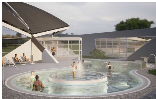
Création d'un nouveau bassin extérieur de 200 m 2 à Thermapolis

La réalisation de ces travaux implique la fermeture temporaire au public de Thermapolis à compter du 24 février et pour une durée estimée de quatre mois . La validité des abonnements et des bons cadeaux préalablement achetés sera reportée automatiquement d'une durée égale à la durée de la fermeture.