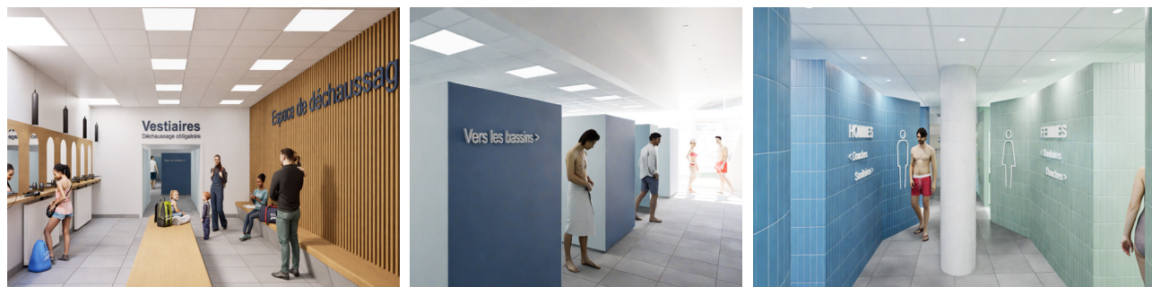
Rénovation des vestiaires de Thermapolis

Du côté de Thermapolis, un double chantier s'annonce. Dans un premier temps, une rénovation intégrale des vestiaires permettra une meilleure organisation des flux avec la création d'un espace dédié au déchaussage. Côté offre, un nouveau bassin extérieur de 200 m 2 sera mis en service à l'automne 2025 avec banquettes à bulles, hydrojets, cols de cygne et pataugeoire centrale avec animation geyser afin de répondre au besoin des familles avec de jeunes enfants.