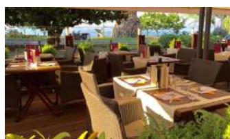
La Villa Borghese