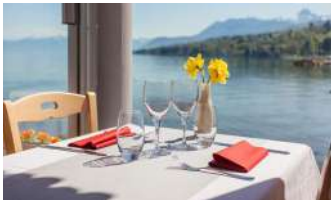
Le radeau d'Alexis