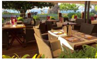
La Villa Borghese