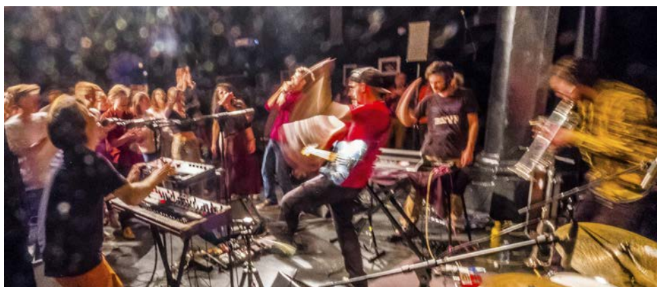
Événement au Jazz Club de Grenoble.

Le Grenoble Festi' Jazz est l'occasion de découvrir chaque année des artistes de jazz qui s'imprègnent de différentes cultures, styles et inspirations. Ce rendez-vous musical créé en 2005 par l'association Jazz Club de Grenoble (qui fête ses 70 ans cette année !) s'accompagne d'une programmation de qualité en phase avec son temps. Les organisateurs ont à cœur de mettre en avant des femmes artistes de talent qui représentent plus de la moitié des musiciens programmés.