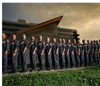
Big Band de l'Œuf

Rendez-vous du vendredi 27 septembre au dimanche 13 octobre 2024 pour la 20 e édition du Grenoble Alpes Métropole Jazz Festival. 16 concerts sont programmés dans 14 salles de l'agglomération grenobloise. Depuis la création du festival en 2005, l'éclectisme est cher aux organisateurs... et l'édition 2024 du festival ne déroge pas à la règle. Dans cette programmation variée on retrouve plusieurs têtes d'affiche : la bassiste et compositrice polonaise Kinga Glyk, la chanteuse et pianiste cubaine Jany McPherson. Mais aussi André Charlier, Benoît Sourisse et Louis Winsberg, des piliers du festival, qui invitent cette année la chanteuse française Malou Oheix et le Big Band de l'Œuf qui présente une création astro-symphonique entre trous noirs, exoplanètes et nouvelles galaxies... De quoi faire le plein de découvertes et savourer les 1001 facettes d'un jazz multiculturel et tout public. Pour prolonger ces moments conviviaux, le Jazz Club de Grenoble organise pendant le festival une jam session ouverte à tous jeudi 3 octobre 2024 à 18 h 30 à la Salle Stendhal.