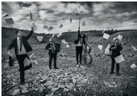
Note Noire Quartet