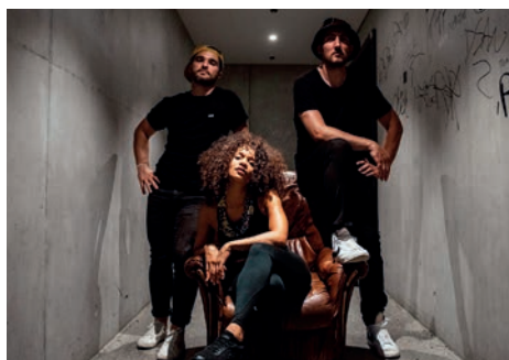
Aïda trio

AUDITORIUM DU MUSÉE DE GRENOBLE - GRENOBLE