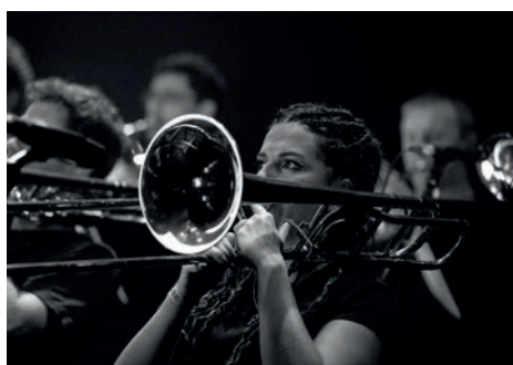
L'Usine à Jazz