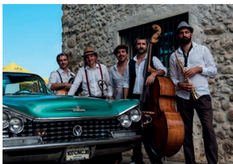
Les Chats badins