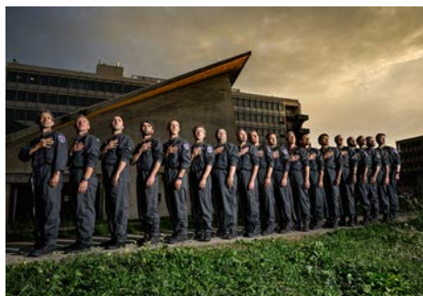
Big Band de l'Œuf