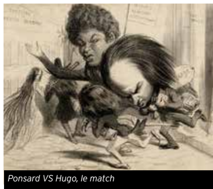
Ponsard VS Hugo, le match