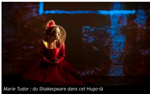
Marie Tudor : du Shakespeare dans cet Hugo-là