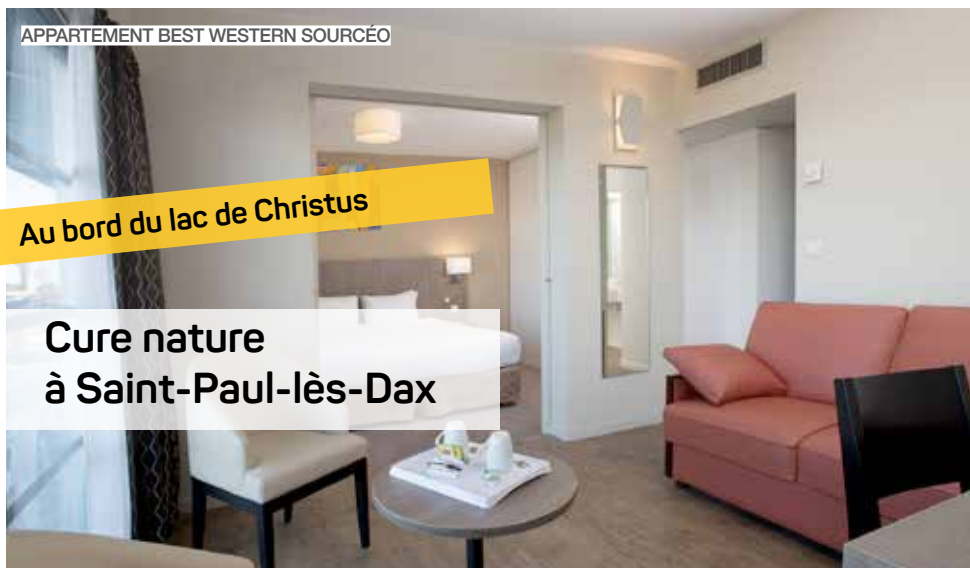
APPARTEMENT BEST WESTERN SOURCÉO