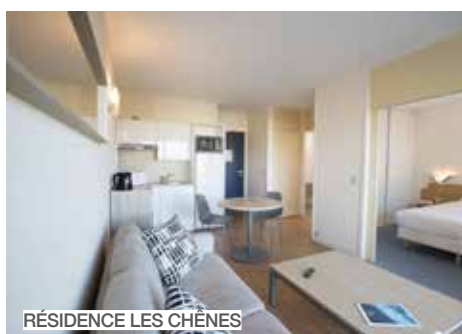
RÉSIDENCE LES CHÊNES