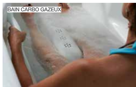
BAIN CARBO GAZEUX