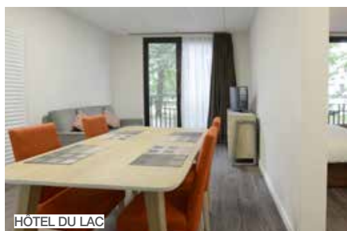
HÔTEL DU LAC

De l'espace, de la lumière, de bonnes ondes et de l'attention ! Les espaces naturels et l'environnement préservé font de Saint-Paul-lès-Dax un havre de paix pour lâcher prise et mettre ses douleurs à distance. Chambre, appartement, studio ou camping, le groupe Thermes Adour offre un large choix d'hébergements et d'ambiances. Bien sûr, l'ensemble des professionnels suivent un protocole sanitaire strict pour un séjour bienfaissant.