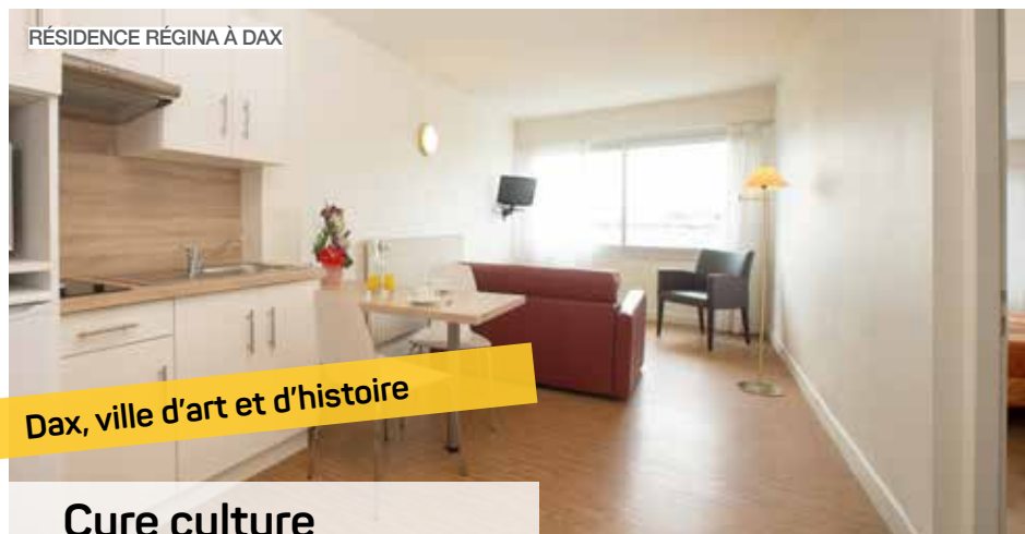
RÉSIDENCE RÉGINA À DAX