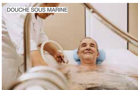
DOUCHE SOUS MARINE