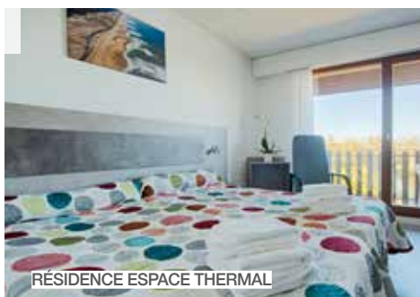
RÉSIDENCE ESPACE THERMAL

Une cure thermale dans une ville d'art et d'histoire. Le territoire dacquois bénéficie en effet de nombreux atouts patrimoniaux. Vestiges antiques, centre ancien, maisons basco-landaises, architecture Art déco, patrimoine thermal, culturel et naturel... Que dire de son marché pittoresque, invitation à goûter à toutes les saveurs des Landes. Chambre, appartement, studio ou camping, le groupe Thermes Adour offre un large choix d'hébergement et d'ambiance. Bien sûr, l'ensemble des professionnels suivent le protocole sanitaire strict pour un séjour serein.