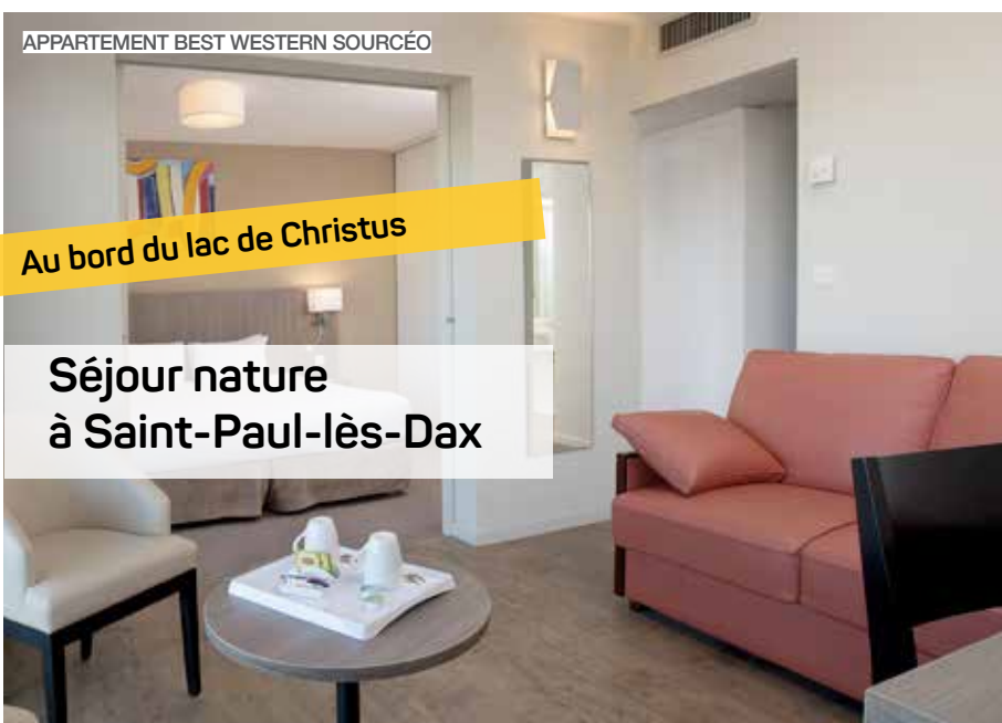
APPARTEMENT BEST WESTERN SOURCÉO