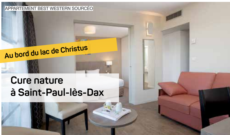
APPARTEMENT BEST WESTERN SOURCÉO