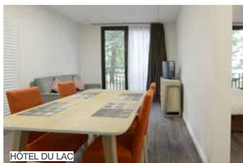
HÔTEL DU LAC

De l'espace, de la lumière, de bonnes ondes et de l'attention ! Ses espaces naturels et son environnement préservé font de Saint-Paul-lès-Dax un lieu de villégiature privilégié pour lâcher prise et mettre ses douleurs à distance. Chambre, appartement, studio ou camping, le groupe Thermes Adour offre un large choix d'hébergement et d'ambiance. Bien sûr, l'ensemble des professionnels suivent un protocole sanitaire strict pour un séjour serein.