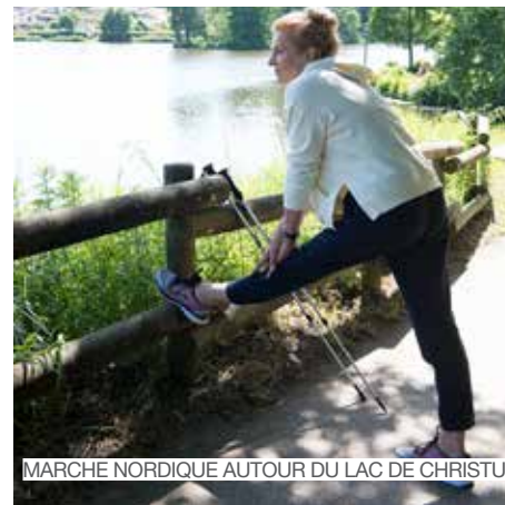
MARCHE NORDIQUE AUTOUR DU LAC DE CHRISTUS