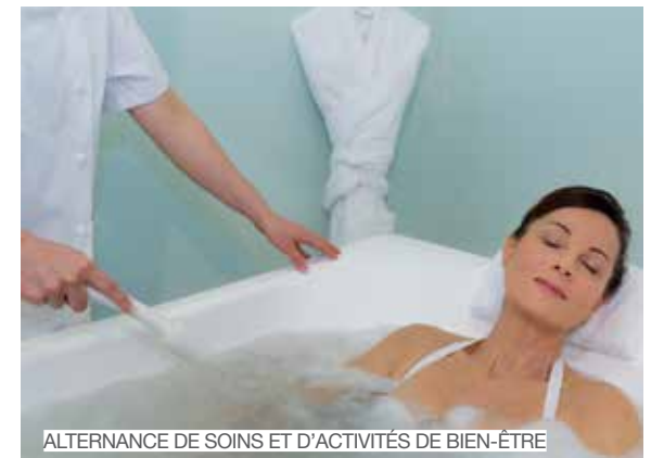
ALTERNANCE DE SOINS ET D'ACTIVITÉS DE BIEN-ÊTRE