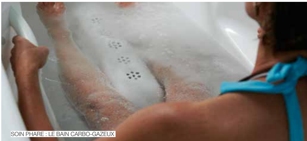
SOIN PHARE : LE BAIN CARBO-GAZEUX