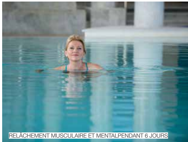
RELÂCHEMENT MUSCULAIRE ET MENTAL PENDANT 6 JOURS