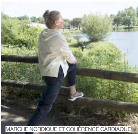
MARCHE NORDIQUE ET COHÉRENCE CARDIAQUE