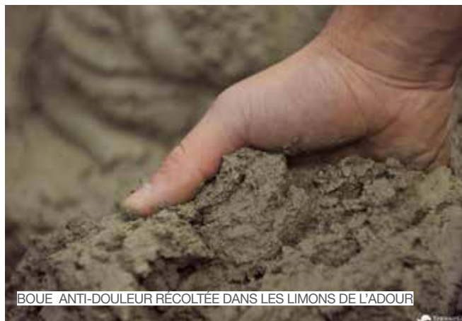
BOUE ANTI-DOULEUR RÉCOLTÉE DANS LES LIMONS DE L'ADOUR