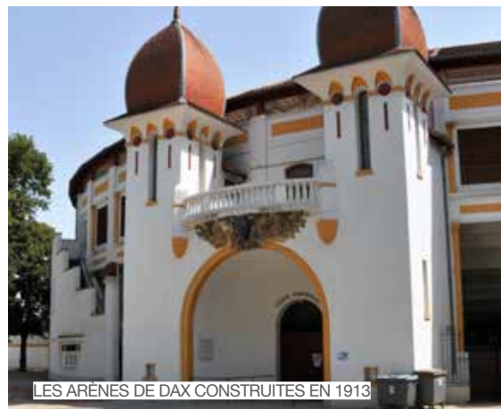
LES ARÈNES DE DAX CONSTRUITES EN 1913