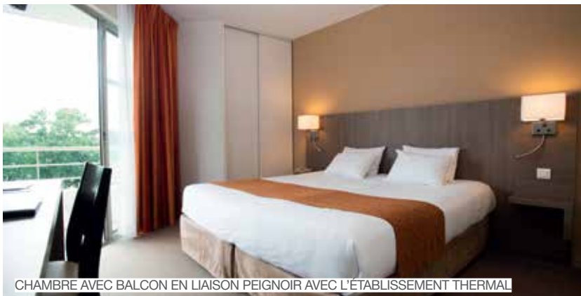
CHAMBRE AVEC BALCON EN LIAISON PEIGNOIR AVEC L'ÉTABLISSEMENT THERMAL