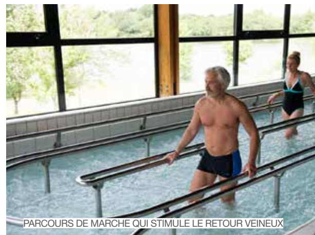
PARCOURS DE MARCHÉ QUI STIMULE LE RETOUR VEINEUX