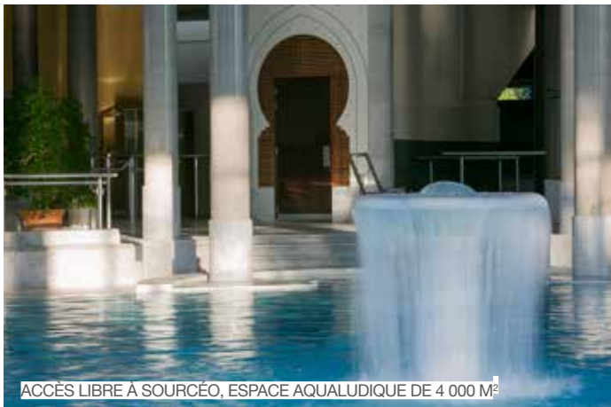
ACCÈS LIBRE À SOURCÉO, ESPACE AQUALUDIQUE DE 4 000 M 2