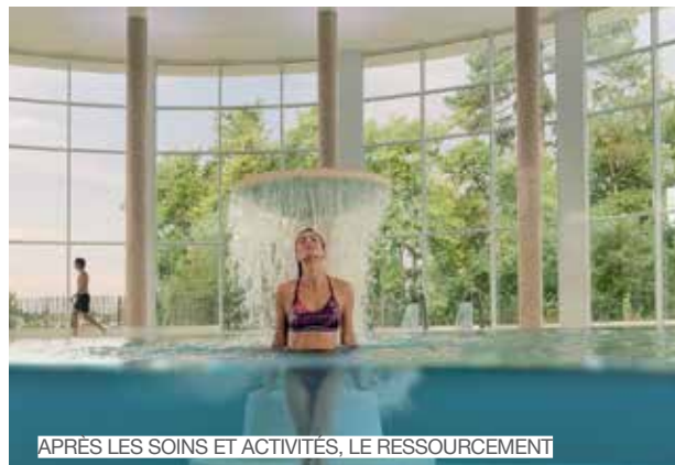
APRÈS LES SOINS ET ACTIVITÉS, LE RESSOURCEMENT