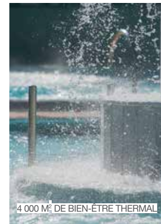
4 000 M 2 DE BIEN-ÊTRE THERMAL