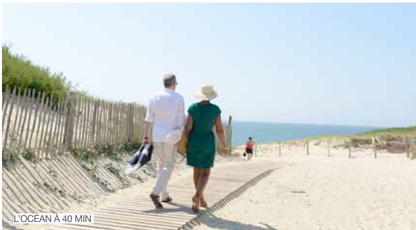
L'Océan à 40 min