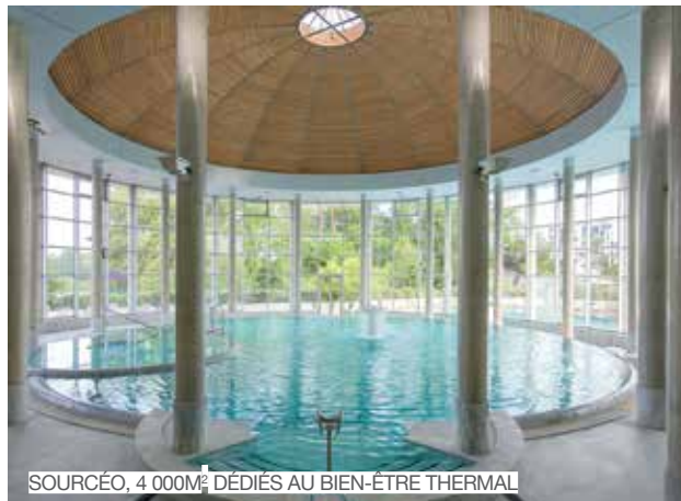
SOURCÉO, 4 000M 2 DÉDIÉS AU BIEN-ÊTRE THERMAL