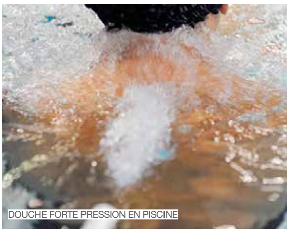
DOUCHE FORTE PRESSION EN PISCINE