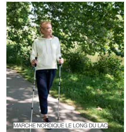
MARCHE NORDIQUE LE LONG DU LAC