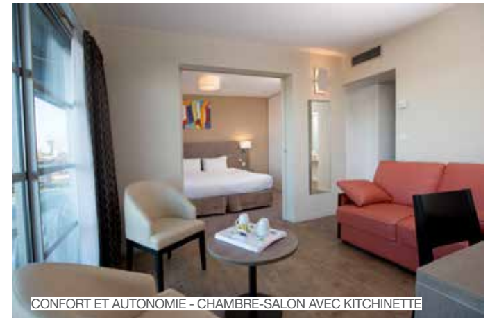
CONFORT ET AUTONOMIE - CHAMBRE-SALON AVEC KITCHINETTE