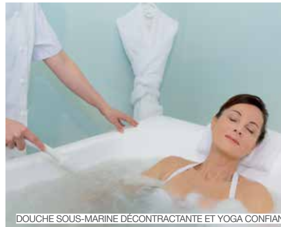
DOUCHE SOUS-MARINE DÉCONTRACTANTE ET YOGA CONFIANCE EN SOI