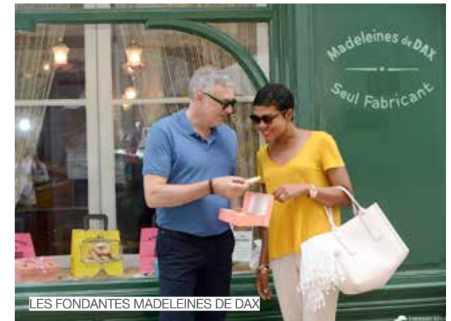
LES FONDANTES MADELEINES DE DAX