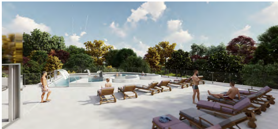
Vues sur le toit-terrasse du nouveau bâtiment dédié à l'activité aquatique et ses cinq bassins à ciel ouvert.