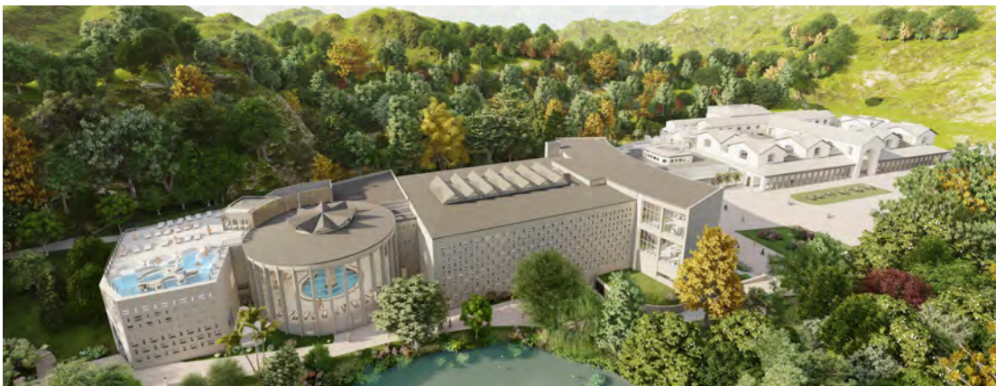
Complexe thermal de Bagnères-de-Luchon. À gauche, l'extension et son bassin thermal aqualudique qui tutoie le ciel sur le toit terrasse.

Revitaliser l'activité thermale, dynamiser celle du bien-être thermal, jouer les synergies entre les filières, mettre en lumière ce riche patrimoine architectural thermal tout en soignant l'accueil et la prise en charge des curistes... Cet ambitieux projet entend redonner son éclat à la « reine des Pyrénées ».