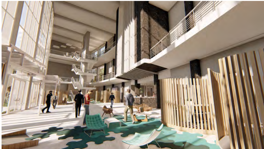
Baigné de lumière, le hall d'accueil du Vaporarium devient le lieu d'enregistrement et d'information des curistes