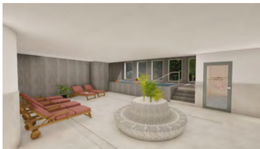
Espace détente du spa

La nouvelle organisation veut simplifier et rendre cohérent le parcours des curistes en créant des zones de soins identifiées. Par exemple, l'Espace Premium et le spa seront aménagés dans l'aile Est du bâtiment Chambert.