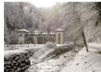
BAINS DU MONT-BLANC À SAINT-GERVAIS

Ouverture partielle avec création inédite d'un parcours thermal :