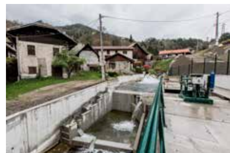
Centrale hydroélectrique de Fredet-Bergès à Villard-Bonnot en Isère.

Cette sélection permet de répondre au volume de clientèle actuelle de Yéli. Elle pourra s'enrichir au fur et à mesure de son développement. Les usagers Yéli peuvent visiter sur demande les ouvrages de production de GEG. L'occasion de comprendre les mécanismes de fabrication de leur électricité et/ou de leur gaz.